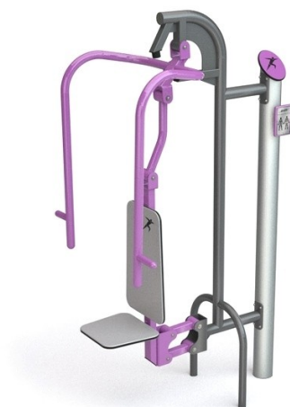
WIDOK PRAWEJ STRONY