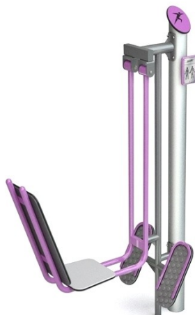
WIDOK LEWEJ STRONY

ZESTAW PODWÓJNY WYPYCHANIE NOGAMI SIEDZĄC + WYCISKANIE RĘKAMI SIEDZIĄC NA JEDNYM WSPÓLNYM PYLONIE