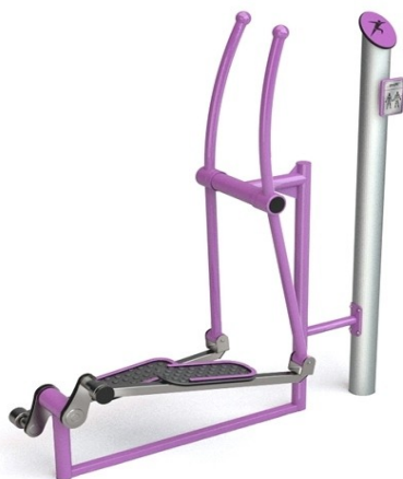
WIDOK LEWEJ STRONY

ZESTAW PODWÓJNY PRZYCIĄGANIE RĘKOMA SIEDZĄC + ORBITREK NA JEDNYM WSPÓLNYM PYLONIE/SŁUPKU