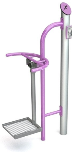
WIDOK PRAWEJ STRONY