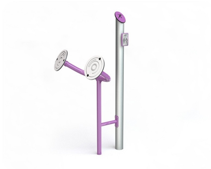
WIDOK LEWEJ STRONY

ZESTAW PODWÓJNY DWA KOŁA TAI CHI + WACHADŁO NA JEDNYM WSPÓLNYM PYLONIE/SŁUPKU