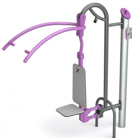
WIDOK PRAWEJ STRONY